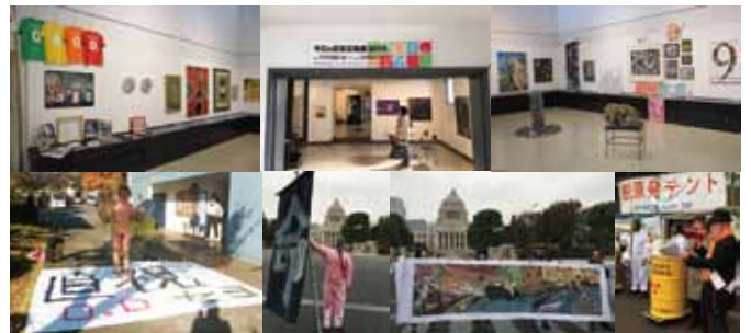
写真は「今日の反核反戦展2015」、出展者による国会前街宣パフォーマンス